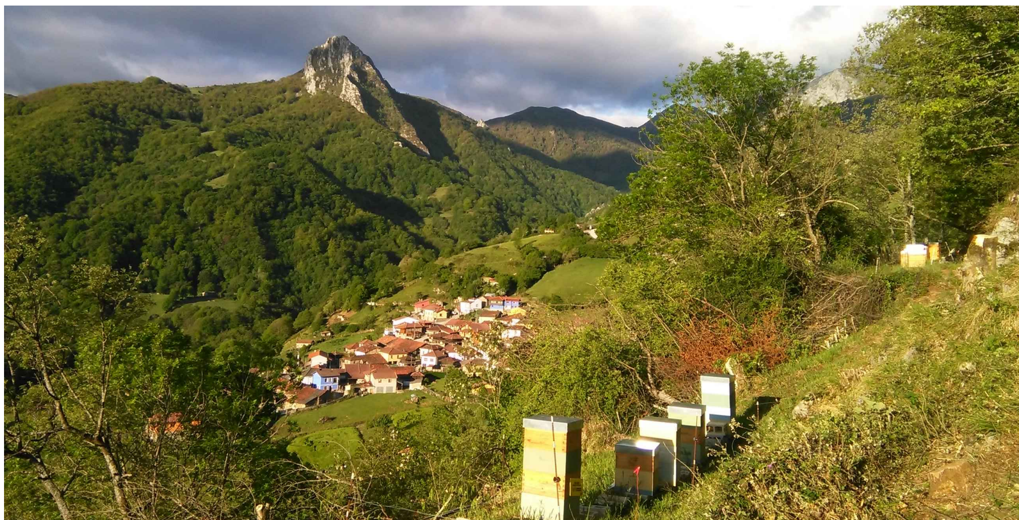
Apiario en Xomezana Riba