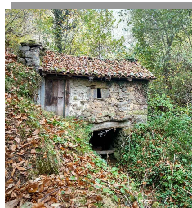
Molino en el Ríu Piquinu