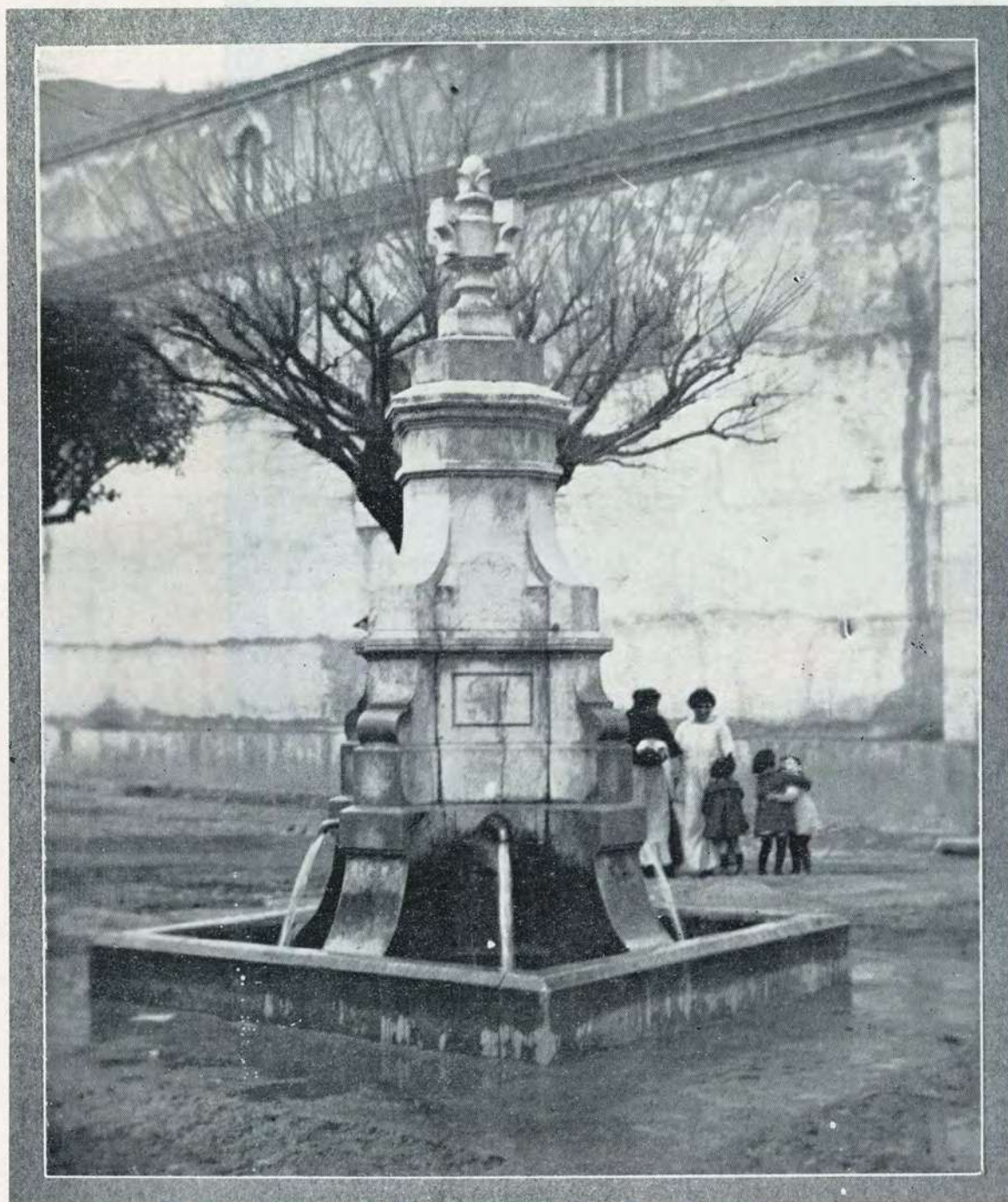
La fuente de San Martín, tras de la Iglesia, con cuatro chorros de agua bendición de Dios. (Fots. Montoto).

«La fuente de San Martín, tras de la Iglesia, con cuatro chorros de agua bendición de Dios»