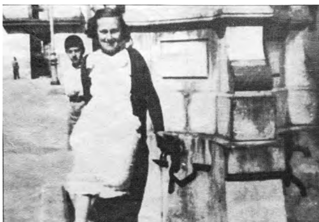
◀ Figuras 5 y 6.

La fuente fue un lugar de encuentro, utilizado también como escenario en el que fotografiarse.