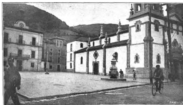
Plaza de la iglesia y Ayuntamiento de Pola de Lena