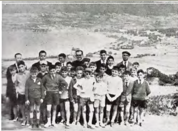
El grupo general de excursionistas ante la magnífica bahía de Cedeira.