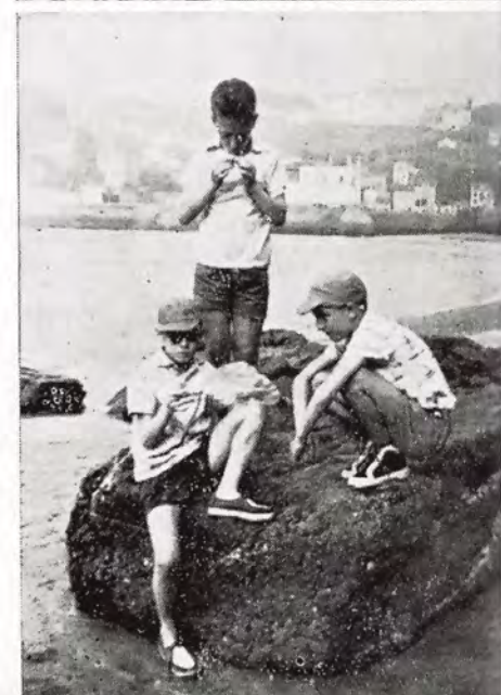
¡Porqué las clases no se darán así, al aire libre!