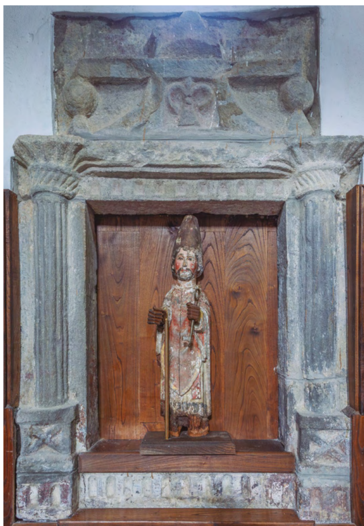
■ Figura 2. Imagen tardorrománica de San Pedro