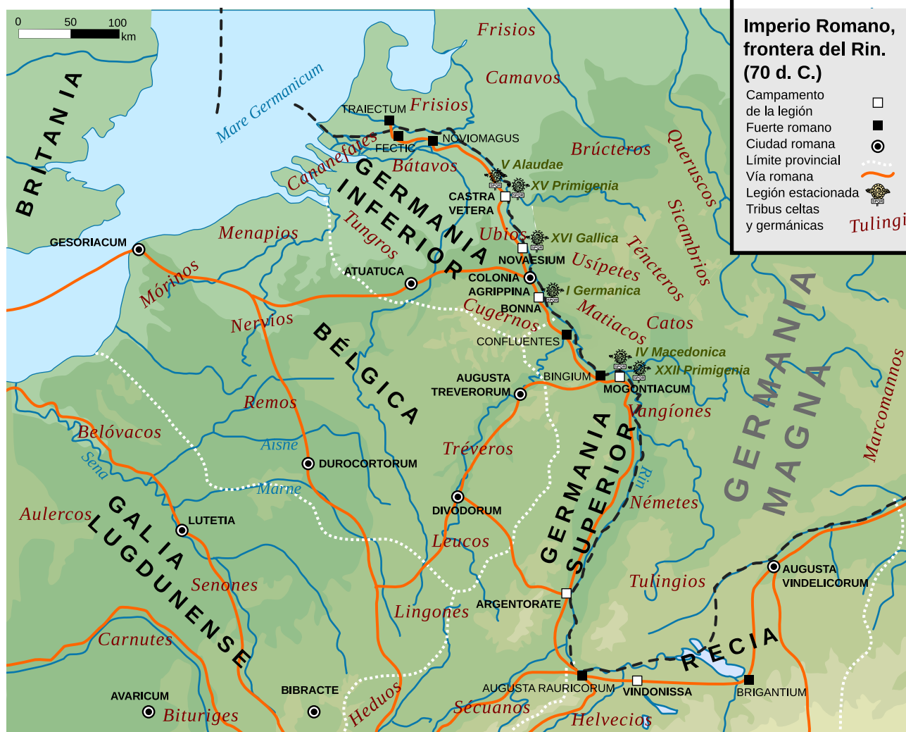
■ Figura 5. Mapa de la frontera del Imperio romano en el Rin, año 70 d.C. (Autor: ArdadN, CC BY-SA 3.0)

El asentamiento de la Cohors V Asturum se identificaría con una fortificación típica del limes , similar a la conocida turris-horologium reconstruida hace unas décadas en Rheinbrohl, muy cerca de la cual se descubrió el epitafio de Pintaius. 32 Se trataba de un puesto avanzado próximo a la antigua Bonna ( Castra Bonnensia ), campamento de la Legio I Germanica , un caput limitis junto al Rin, en la frontera de Germania con Retia.